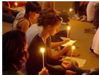
Im Gebet mit den Brüdern und hunderten Jugendlichen verbunden...