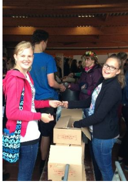
Mithilfe bei der Essensausgabe