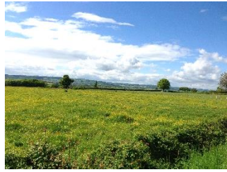
Taizé im Burgund, super schön gelegen!